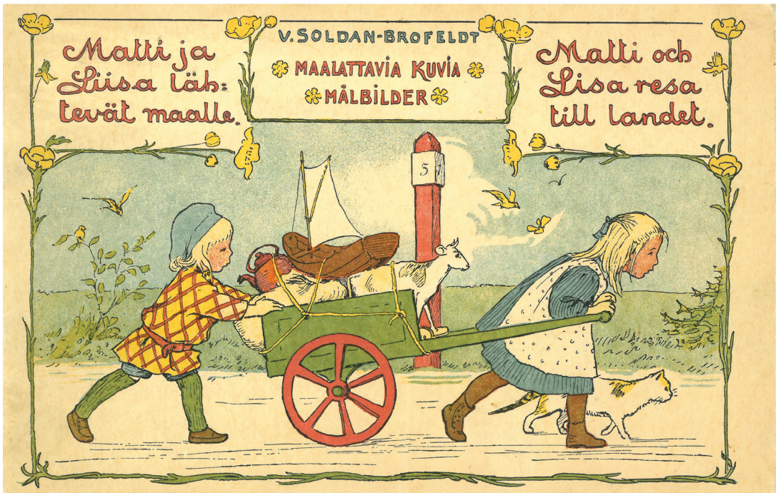
Venny Soldan-Brofeldt on kuvittanut vuonna 1902 julkaistun värityskirjan Matti ja Liisa lähtevät maalle . Kirjan sisältää 12 kokosivun kuvaa ja kolme käsin maalattua mallikuvaa. Kuvassa olevan vuoden 1937 painoksen kantta on muokattu ja väritysmallit poistettu.